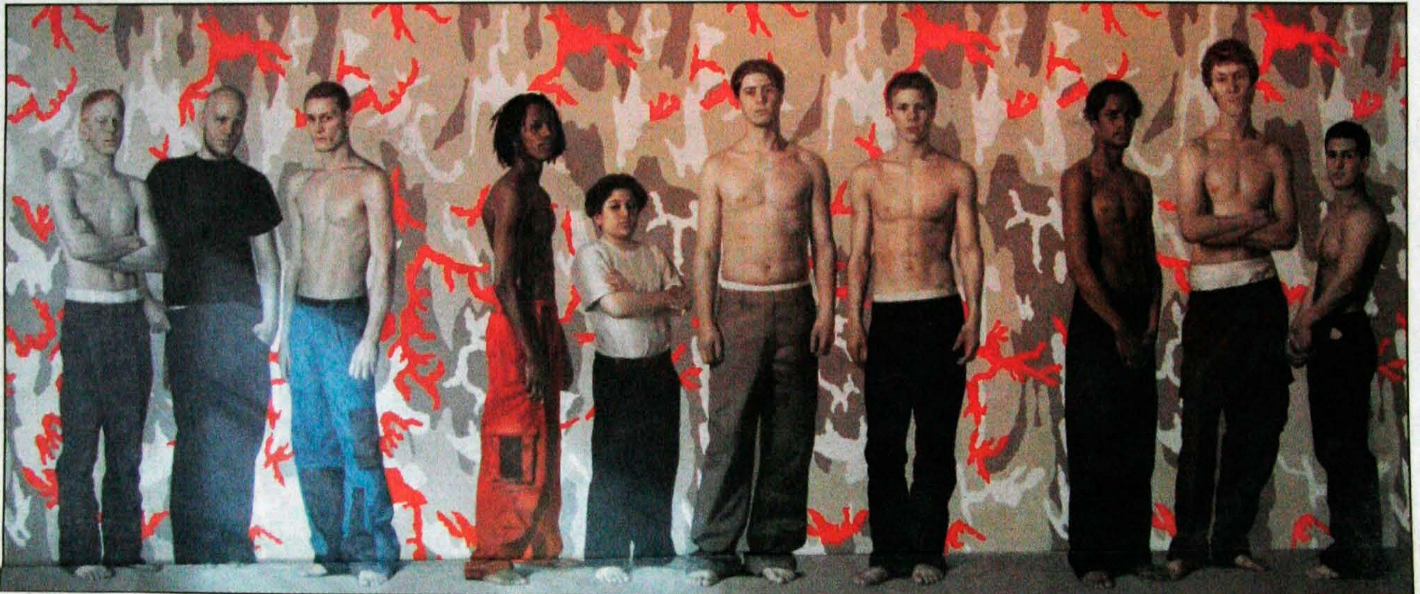
KOLLEKTIV OG KAMUFLASJE: Modellene på Bjertnæs' monumentale maleri er avmålte, men signaliserer likevel mer gjennom kroppsspråket enn den Warhol-inspirerte kamuflasjen bak dem skulle tilsi.